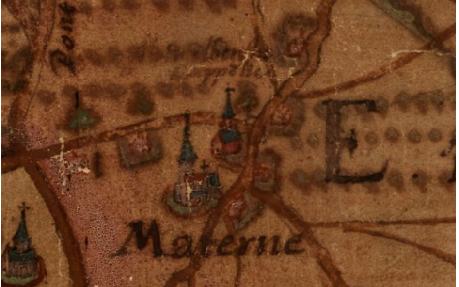
Snede uit de Horenbaultkaart (1596) t.h.v. Mater. De kleine kerk bovenaan is de eerste Sint-Martinuskerk, te situeren waar thans de Sint-Amelbergakapel staat. Langs de kerken loopt een voorganger van de huidige hoofdrijweg.

Ook het kerkhof is door de eeuwen heen verschillende malen aangepast. Het eerste kerkhof zal zich rond de eerste Sint-Martinuskerk bevonden hebben. Met de bouw van de tweede kerk zal het kerkhof mee verhuisd zijn. Sinds 1954 worden de inwoners van Mater opnieuw begraven op een nieuw kerkhof aan de Sint-Amelbergakapel. Ten noorden van de huidige kerk is een graf aangetroffen dat ten laatste in de 16de eeuw te dateren is. Dit toont aan dat er hier nog restanten van het kerkhof rond de tweede of misschien zelfs de eerste Sint-Martinuskerk aanwezig zijn. Ook op de westelijke helft van het Materplein zijn graven aangetroffen. Deze zijn wellicht allen in de 18de tot 20ste eeuw te dateren en zullen dus meestal te linken zijn aan de huidige kerk. Enkele graven bevinden zich dicht bij de huidige schoolpoort, buiten elke gekende begrenzing van het kerkhof. Mogelijk is er een fout aanwezig in de historisch-cartografische bronnen. Anderzijds zou het ook kunnen gaan om protestantse graven. Er was immers in Mater een relatief grote hoeveelheid protestanten aanwezig, in het bijzonder in de 16de en 17de eeuw na de beeldenstorm van 1566. Mogelijk mochten/wilden zij niet op het katholieke kerkhof begraven worden.