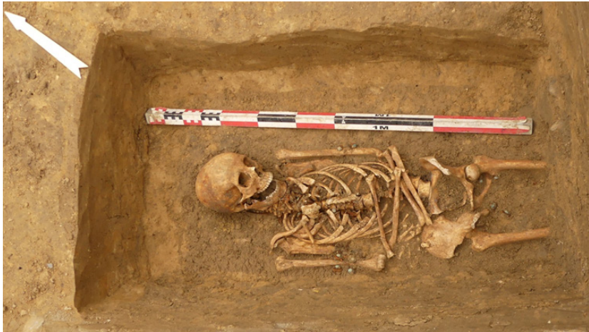
Het graf van een jonge vrouw tussen 18 en 23 jaar. Het bevindt zich voor de huidige schoolingang, buiten enige gekende grenzen van het vroegere kerkhof.

Tot slot zijn er tijdens het vooronderzoek ook verschillende restanten van bakstenen muren en gebouwen aangetroffen ten noorden van de kerk. Het gaat onder meer om de kerkhofmuur van een vroegere fase van het kerkhof. Deze sluit aan op de funderingen van een vleugel van het zogenaamde 'Gemeentehuis'. De kerkhofmuur en het gebouw zijn in 1966 afgebroken. Uit historische en historisch-cartografische bronnen weten we dat het 'Gemeentehuis' minstens uit de 18de eeuw dateert. Het archeologisch vondstmateriaal bevestigt dit.