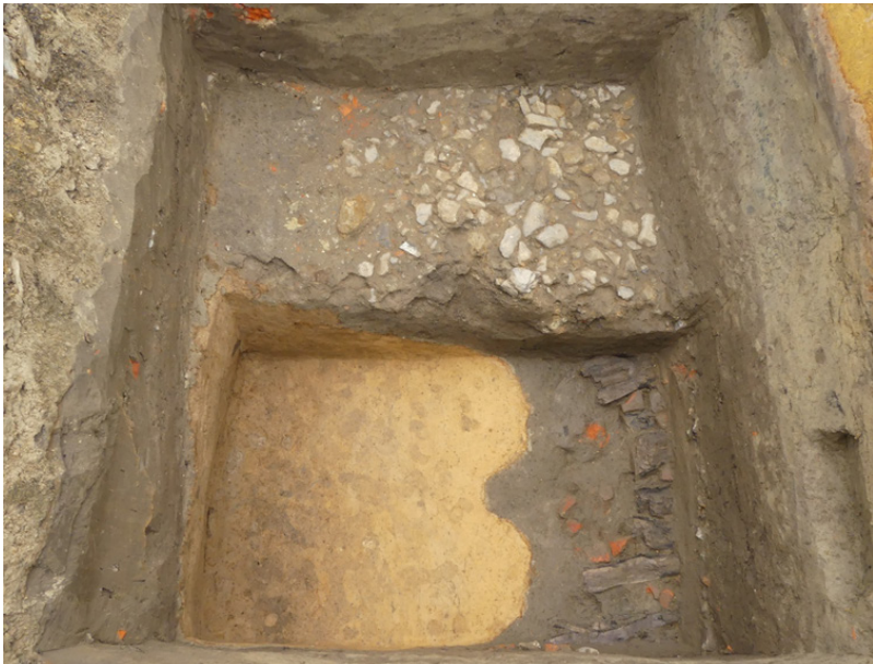
Zicht op enkele voorgangers van de huidige hoofdrijweg. Bovenaan een kasseiweg uit de 17de-18de eeuw en onderaan een ouder wegniveau op houten liggers en bakstenen, aangelegd in de opgevlude “holle weg”.

Vooraf uit de Romeinse periode kennen we een aantal sites in de omgeving van Mater. Dit hoeft niet te verbazen gezien de belangrijke Romeinse weg van Hofstade (Zemst) over Velzeke (Zottegem) naar Kortrijk ook over Mater liep. Deze is ca. 600 m ten noordwesten van het Materplein te situeren. Tijdens het proefputtenonderzoek zijn ten oosten van de kerk, onder de straat, verschillende voorlopers van de huidige wegenis teruggevonden, waaronder een kasseiweg uit de 17de of 18de eeuw en een nog ouder wegniveau op houten liggers. Het alleroudste wegniveau was echter onverhard waardoor een zogenaamde ‘holle weg’ ontstond. Ze kan voorlopig niet gedateerd worden. Het behoort tot één van de mogelijkheden dat deze ‘holle weg’ het overblijfsel is van een secundaire weg uit de Romeinse periode, verbonden met de hoofdweg Hofstade-Velzeke-Kortrijk.